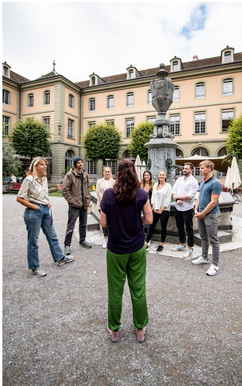
Dialogische Einführung, bevor es in den «Raum zum Scheitern» geht.

Das Licht im «Raum zum Scheitern» ist gedämpft. Grosszügige Sitzkissen bieten Platz, um sich in Ruhe die Scheitergeschichten anderer Menschen anzuhören. Wer mag, trinkt eine Tasse Tee und kommt ins