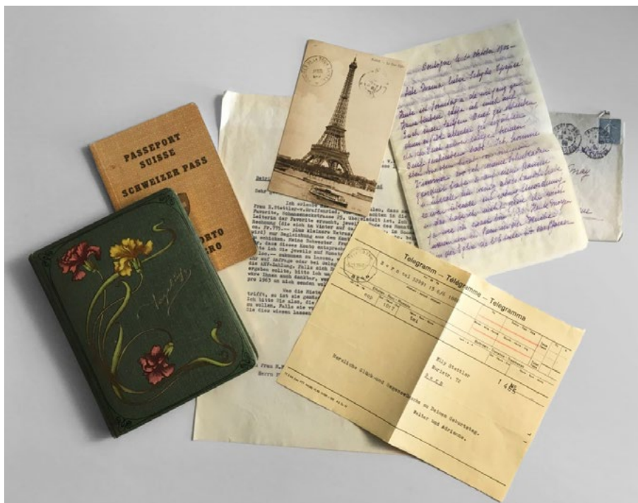
In Familienarchiven findet sich eine Vielfalt von Unterlagen.

Bei Familienmitgliedern, die sich mit der Absicht eines dauerhaften Erhalts von Familienpapieren und deren Zugänglichmachung an die Burgerbibliothek wenden, ist jeweils ein starkes Verantwortungsgefühl gegenüber dem Familienerbe und den vorangehenden Generationen spürbar. Unsicherheit besteht häufig darüber, welche Unterlagen als archivwürdig einzustufen sind. Nicht selten schwingt zudem die Sorge um den Daten- und Persönlichkeitsschutz mit. Im beratenden Gespräch werden offene Fragen besprochen und es wird gemeinsam eine Lösung gefunden.