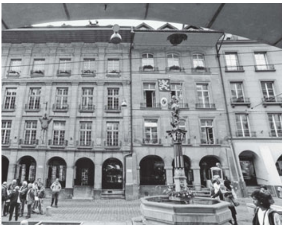
Keine andere Berner Bürgerhausfassade kennt diese extreme Dominanz des Vertikalsystems.

Zu bestellen bei Thalia ( www.thalia.ch )