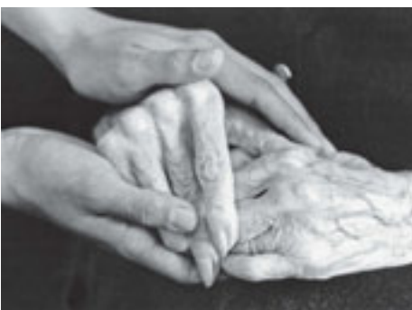
... und Betreuung.

Der Regierungsrat des Kantons Bern hat ebenfalls beschlossen, auch die Finanzierung der Infrastruktur (Gebäude, Einrichtungen) zu ändern.