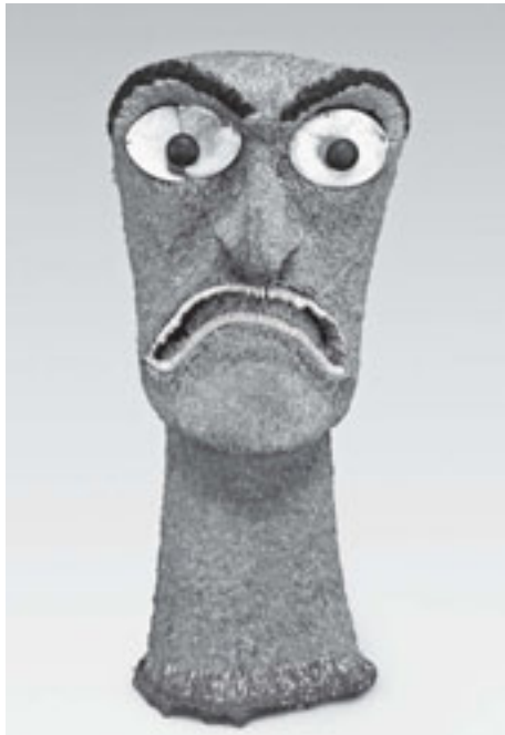
Federgott ki'i hulu manu, Hawaii. Mit Federn geschmückte Götterbilder zählen zu den heiligsten Gegenständen der hawaiischen Kultur. Dieser Federgott gelangte 1779 während des Erntefestes makahiki im James Cooks Besitz, (The British Museum, London)