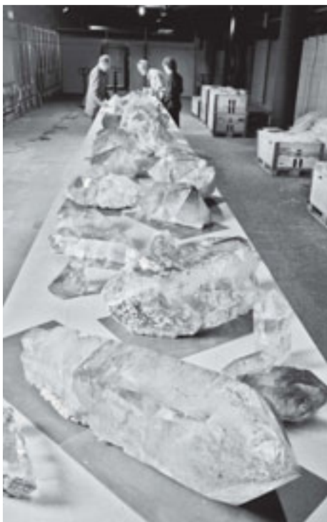
Auslegeordnung der Kristalle vom Planggenstock.

Nach dem Transport der Planggenstock-Kristalle vom Kanton Uri ins Naturhistorische Museum am 11. Januar dieses Jahres lagen sie sicher eingepackt mehrere Monate im Keller. Erst kürzlich war die Vorbereitung des Ausstellungsraumes im 1. Untergeschoss des Erweiterungsbaus so weit fortgeschritten, dass die Kristalle ausgepackt und auf einem riesigen, von den Schreibern speziell angefertigten Tisch ausgelegt werden konnten. Erstmals konnte sich nun das Ausstellungsteam ein umfassendes Bild von den genauen Eigenschaften und dem Umfang der zur Ausstellung bestimmten Kristalle machen. Dabei handelt es sich um den gesamten sensationellen Fund von 2005/06. Dieser umfasst mehr als 50 hochglänzende und meist ausserordentlich klare, leicht rauchfarbene Bergkristalle im Gesamtgewicht von rund zwei Tonnen. Für die Planggenstock-Ausstellung musste Anfang August ein Teil der Geologieausstellung «Erde – Planet und Lebensraum» geschlossen werden. In diesem Raum wird nun die Ausstellung mit den Kristallen und dazugehörigen Informationen aufgebaut.