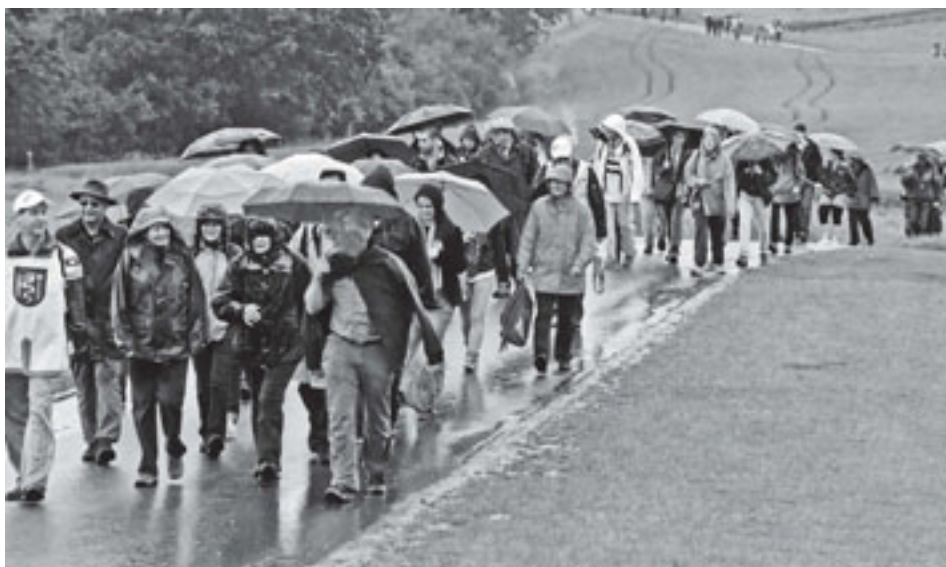
Dem Regen trotzend: Aufstieg zum Gurten.