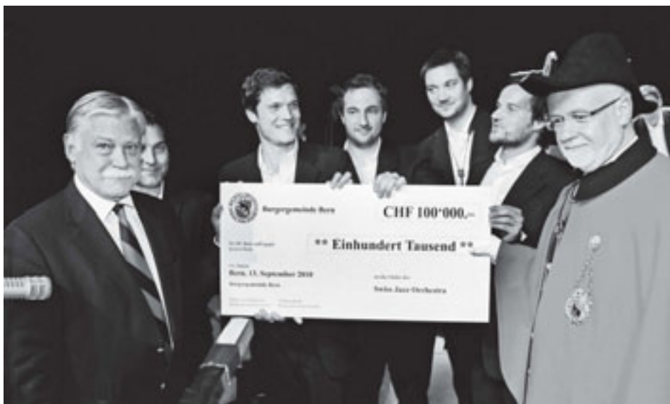
Der grosse Moment der Preisübergabe.

Das Gros dieser Berufsmusiker stammt aus dem Raum Bern und hat in der Regel die Swiss Jazz School absolviert.