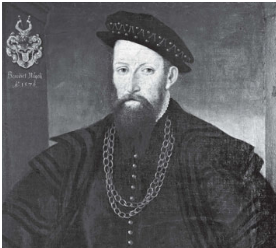
Porträt von Bendicht Nägeli, 1576, Bernisches Historisches Museum, Inv. 23200.