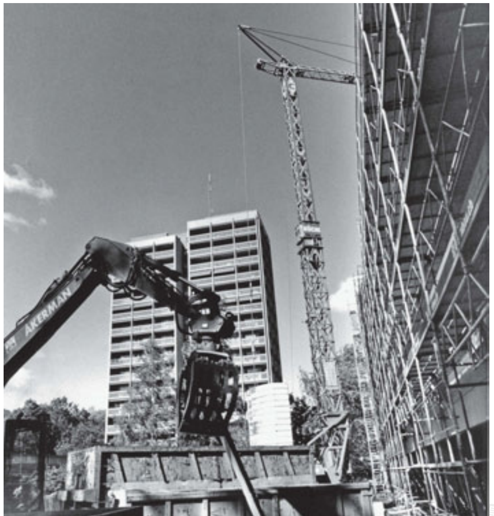
...Tage darauf wird es wieder laut auf dem Gelände.