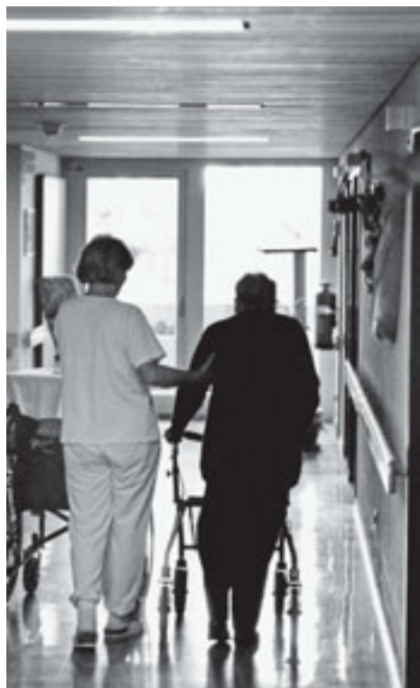
Die neue Pflegefinanzierung bringt eine klare Trennung zwischen Pflege...

Bewohner höchstens noch Fr. 21.60 pro Tag an die Pflegeleistungen bezahlen müssen. Die restlichen Kosten für die Pflegeleistungen übernimmt der Kanton. Dies hat erfreulicherweise zur Folge, dass Bewohnerinnen und Bewohner in den mittleren und hohen Pflegestufen ab 2011 finanziell deutlich entlastet werden.