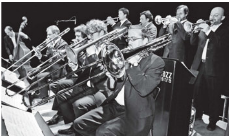
«Eine Big Band von beeindruckender Qualität.»

Die Burgergemeinde Bern hat den Kulturpreis 2010 dem Swiss Jazz Orchestra verliehen