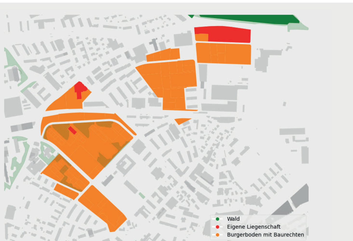
Bürgerlicher Landbesitz in Bümpliz. (Daten: Bürgergemeinde/Kanton Bern)

Parallel dazu modernisiert die Bürgergemeinde ihre Öffentlichkeitsarbeit. Einst wurden Journalist*innen, die kritische Artikel zur Bürgergemeinde verfasst hatten, zu Einzelgesprächen mit der Bürger-Spitze aufgeboten. Inzwischen beantwortet die Bürgergemeinde kritische Anfra-