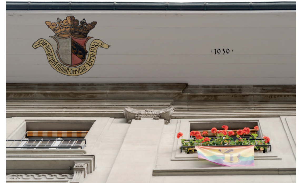
Das Emblem des Vereins für Bürger*innen, die keiner Zunft angehören: der Bürgergesellschaft.

Zunftgesellschaft zu Metzgern: Bekannt für den traditionellen Herbstanlass namens «Rüebli-mahl», das auch als «Armenspeisung» gedacht war. Das «Rüebli-mahl» ist Männern vorbehalten und alles andere als vegetarisch. Der Ursprung des Begriffs ist unbekannt, aber das «Rüebli-mahl» artete immer wieder zu Ess- und Trinkorgien aus. Man musste sich Mässigung auferlegen, um die Kosten nicht eskalieren zu lassen.