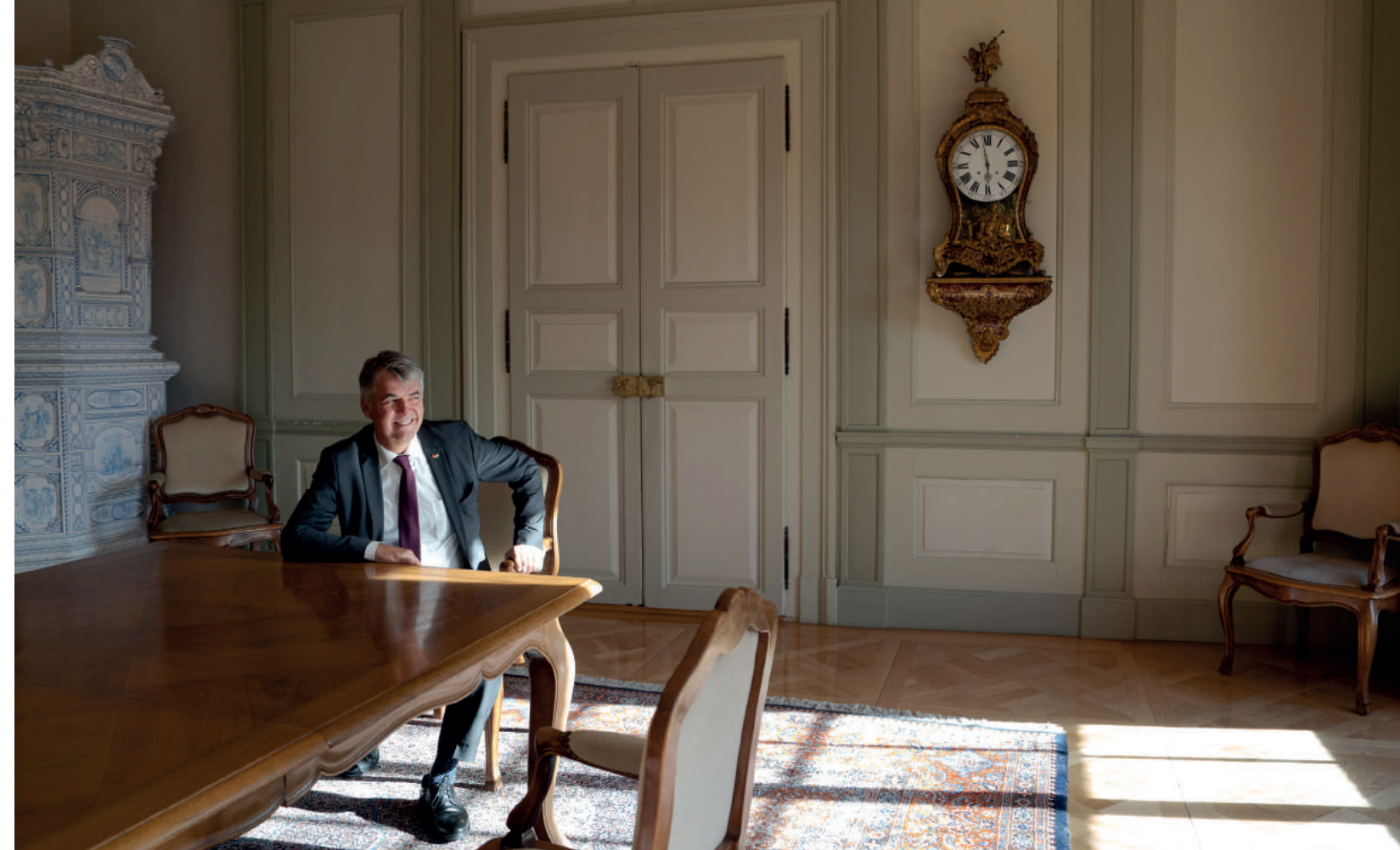
Stadtpräsident Alec von Graffenried (GFL) ist einer von 15 Berner Politiker*innen, die der Bürgergemeinde angehören.

Es ist Usus der Bürgergemeinde, vor Wahlen in einem Schreiben an alle in Bern wohnhaften Bürger*innen die-