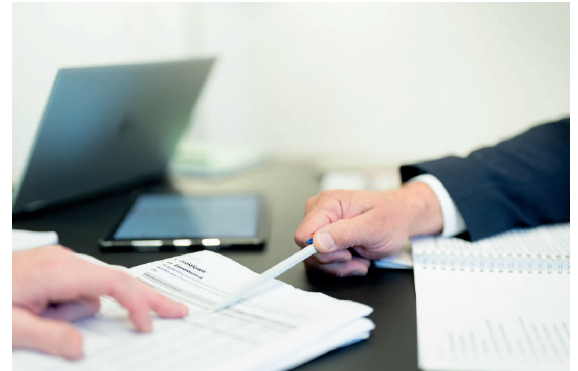
Die Burgergemeinde besitzt Grundstücke im Wert von 672 Millionen Franken sowie Immobilien im Wert von 412 Millionen Franken.

Sehr weit ist das Spektrum der Institutionen oder Projekte, die von der Burgergemeinde mitgetragen oder unterstützt werden. Darunter sind grosse Player wie das Historische Museum oder die Stiftung Bühnen Bern; aber auch kleinere bis sehr kleine wie das Kulturlokal ONO, das Schulmuseum in Köniz oder der Jazz-Konzertveranstalter Zollyphon in Zollikofen. Auch die «Hauptstadt» erhielt