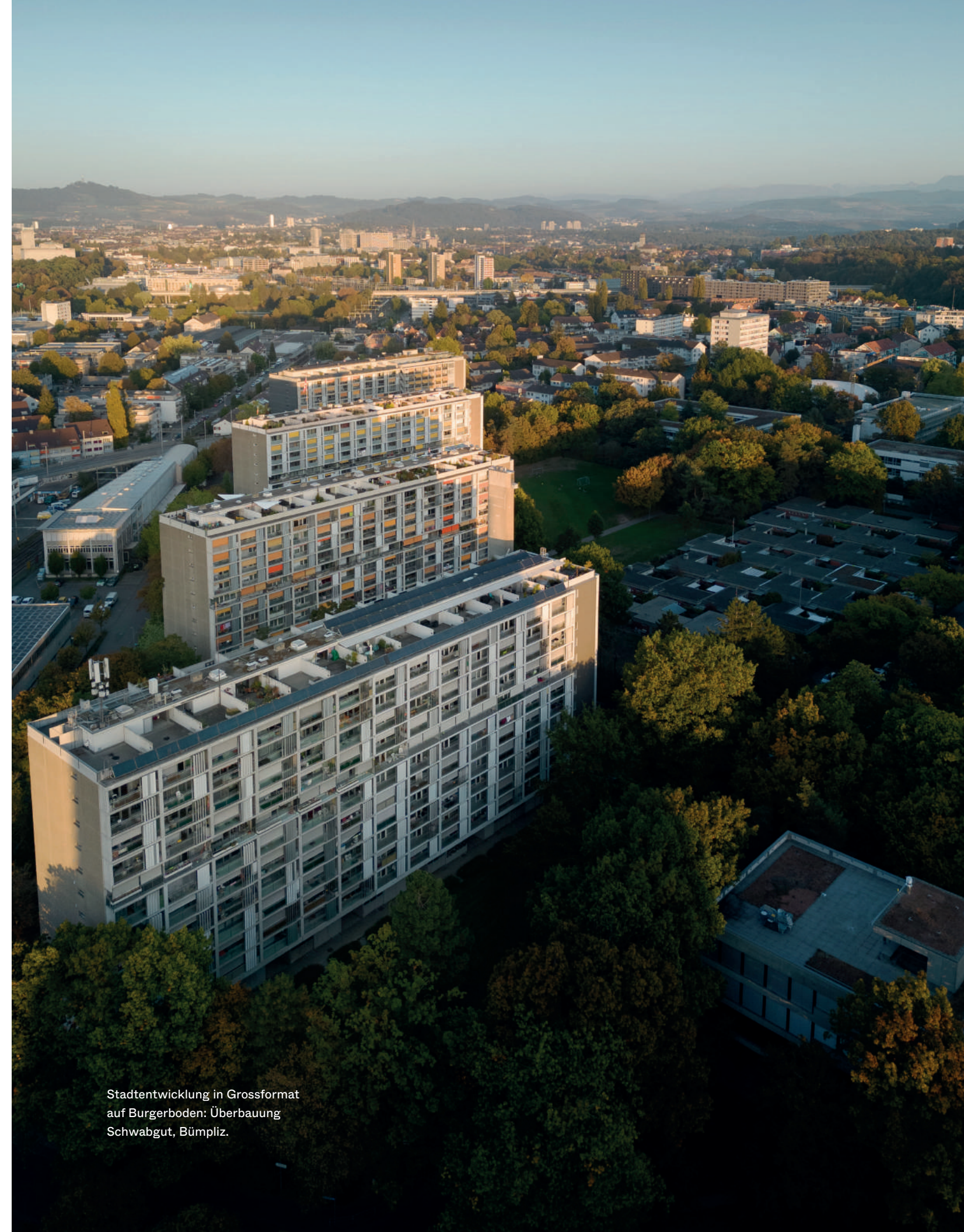
Stadtentwicklung in Grossformat auf Burgerboden: Überbauung Schwabgut, Bümpliz.

Weit aus dem Fenster lehnen sich die Burger bei der Kornhausbrücke. Für diese gibt es ein weniger teures Alternativprojekt, das vom Waisenhausplatz hinüber in den Altenberg