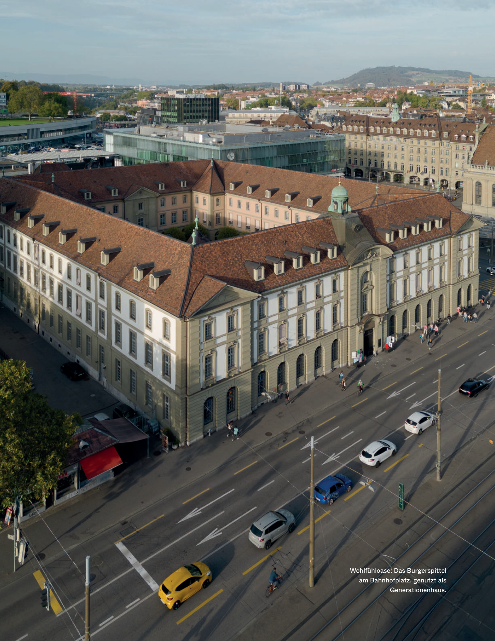
Wohlfühloase: Das Burgerspital am Bahnhofplatz, genutzt als Generationenhaus.

Ein erstes Mal erkennen die Berner Bürger, dass sie ihre Strategie anpassen und sich integrieren müssen, wenn sie nicht ständig in Frage gestellt werden wollen.