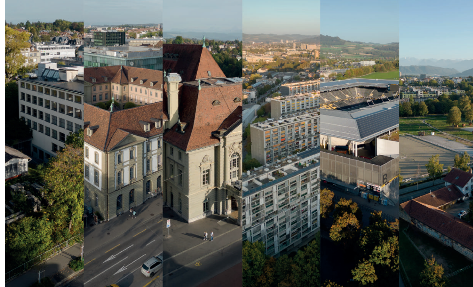
Naturhistorisches Museum, Burgerspittel, Casino, Überbauung Schwabgut, Wankdorfstadion, Springgarten: Die Stadt der Burgergemeinde.

Man nennt es Ancien Régime: Stadt und Kanton sind eins, und der extrem schlanke Staat besteht ausschliess-