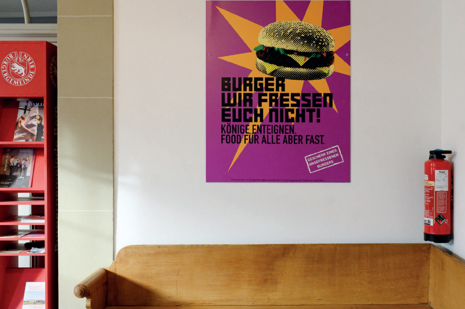
Kritik willkommen: Plakat am Eingang zu den Büros der Burgergemeinde im Generationenhaus.

wurden nicht alle Gesuche behandelt, Absagen gab es bisher für 127 Eingaben.