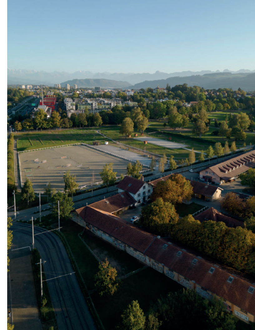
Das Casino steht symbolisch für Kultur, Kulinarik und Bürgerpolitik. Der Springgarten beim Guisanplatz ist eine Baulandreserve der Bürgergemeinde an bester Lage.