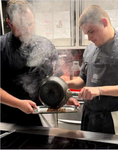
In der Testphase zeigt sich, ob ein Gericht auf die Karte passt.