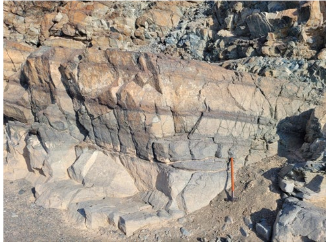
Gesteine mit unterschiedlichen Lagen, die bei sehr hohen Temperaturen in einer Magmakammer entstanden sind.

Diese zehn Tage haben mich nachhaltig geprägt. Die Reise hat mir die Bedeutung dieses Projekts deutlich vor Augen geführt: die Einzigartigkeit der Sammlung und die wissenschaftliche Präzision, die dahintersteht. Ich kann heute nachvollziehen, warum dieses Projekt in den vergangenen 25 Jahren so viele Menschen immer wieder in den Oman gezogen hat. Wenn ich heute durch unsere Ausstellung schlendere und die Vitrine zum Oman sehe, kehren die vielen Erinnerungen an die Reise zurück – und mit ihnen der leise Wunsch, eines Tages vielleicht selbst einen Meteoriten zu finden. >>