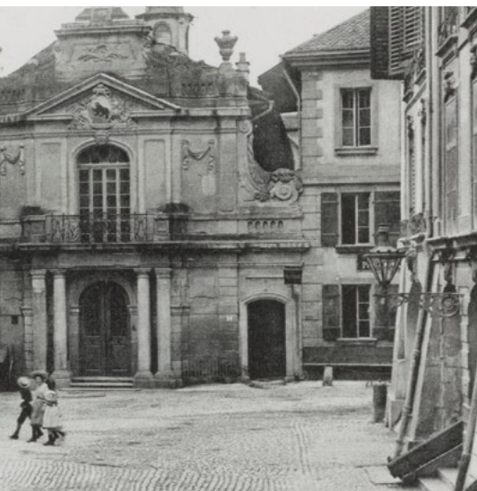
Der Casinoplatz mit der Bürgerbibliothek und dem Casino Bern Anfang des 20. Jahrhunderts (AK 386).

1951 erhält die Bürgerbibliothek ihre heutige Aufgabe und Rechtsform. Aus der bisherigen Stadt- und Hochschulbibliothek entstehen zwei Institutionen: die Bürgerbibliothek, die den historischen Namen beibehält und die handschriftlichen, grafischen und fotografischen Sammlungen übernimmt, und die Stiftung Stadt- und Universitätsbibliothek, die weiterhin Bücher betreut. Damit beginnt die Entwicklung der Bürgerbibliothek als eigenständiges Archiv.