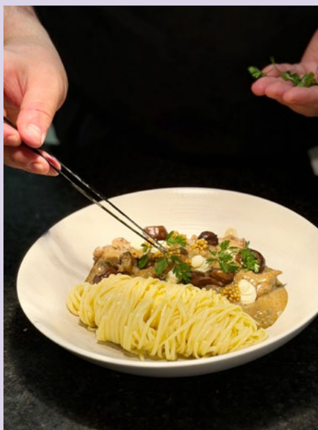
Die Feinarbeit entscheidet in den letzten Schritten.

In der letzten Woche verändert sich das Haus spürbar. Die Küche prüft Abläufe, die Pâtisserie finalisiert die Desserts, die Administration druckt die neue Speisekarte und das Serviceteam lernt die Gerichte kennen und bereitet den Austausch der Karten vor. Trotz allem herrscht ruhige Stimmung: Über die Jahre ist der Ablauf vertraut geworden; alle wissen, was zu tun ist, und können sich aufeinander verlassen.