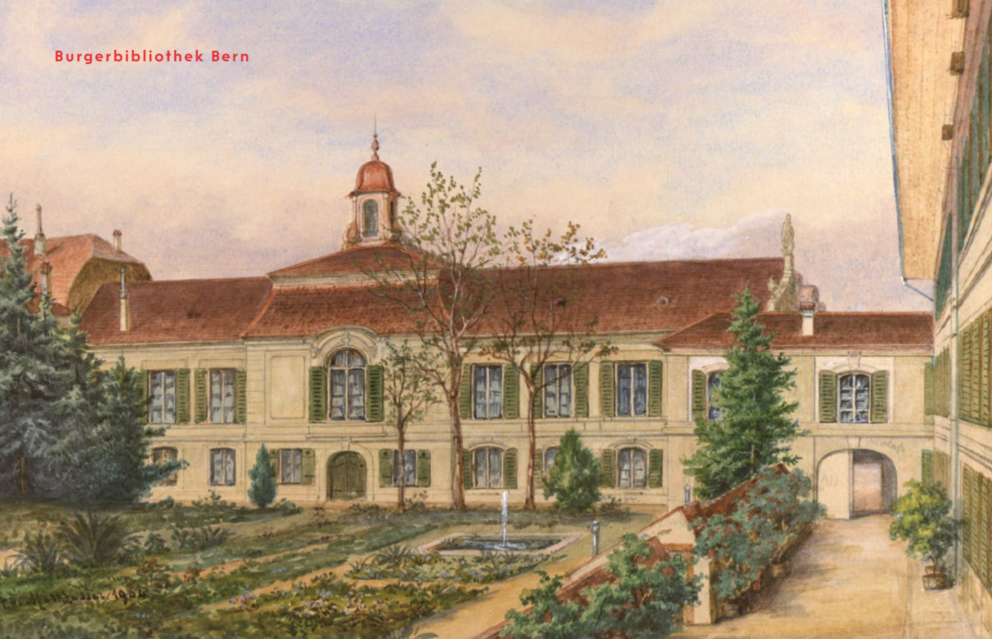
Die ehemalige Bibliotheksgalerie und der botanische Garten nach dem Berner Maler Adolf Methfessel, 1904 (Gr.C.296).