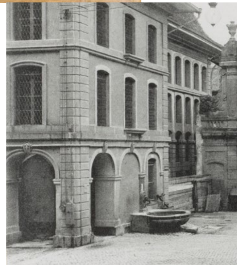
Blick auf die Bibliotheksgalerie von der Hotelgasse aus, 1909 (F.P.E.28).

Ab dem 17. Jahrhundert entwickelt sich die Institution als «Burgerbibliothek» zu einem barocken Wissenszentrum: Bibliothek, Kunstkammer und Naturalienkabinett unter einem Dach. Diese Einheit löst sich im 19. Jahrhundert auf. Die Bücher und schriftlichen Dokumente verbleiben in der Bibliothek, während die Objekte an neu entstandene Institutionen wie das Bernische Historische Museum oder das Naturhistorische Museum gehen.