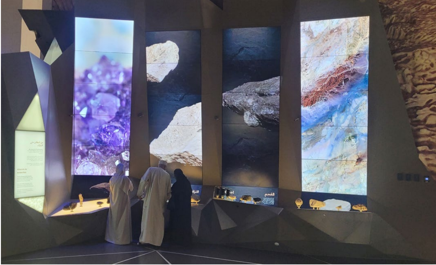
Gesteine zum Anfassen im Museum Oman Across Ages.

Da sich mein wissenschaftliches Interesse auf Rohstoffe und Erze richtet, war das Gebirge im Norden des Oman für mich ein echtes Highlight. Besonders dankbar bin ich dafür, dass ich einige ehemalige Minen besuchen durfte, in denen früher Chromit abgebaut wurde – ein chromreiches Mineral und bis heute ein wichtiger Rohstoff, unter anderem für die Stahlindustrie. Ich hatte die Gelegenheit, mehrere Gesteinsproben zu sammeln, sowohl für die Sammlung des Naturhistorischen Museums als auch für zukünftige wissenschaftliche Untersuchungen. Wie schwer solche Erze sind, wurde mir beim Abstieg wieder bewusst.