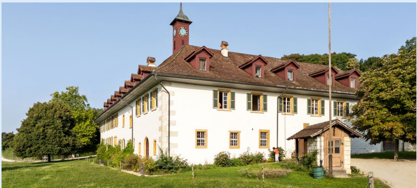
An der bürgerlichen Urnenabstimmung vom 1. Juli 2026 steht das historische Hotel auf der St. Petersinsel im Mittelpunkt.

Besonderes Augenmerk gilt dem berühmtesten Raum des Hauses: dem Zimmer, in dem Jean-Jacques Rousseau 1765 während seines Exils lebte. Die Burgergemeinde wird es sanft auffrischen. Künftig soll es weiterhin als Trauzimmer und als Ort dienen, an dem Geschichte erlebbar wird. Insgesamt beantragt die Burgergemeinde beim Stimmvolk einen Verpflichtungskredit von 9,2 Millionen Franken. Neben den Baukosten umfasst dieser Kredit Beiträge an das neue Hotelinventar sowie an ein modernes Inseltaxi-boot, das künftig den Transport zwischen Erlach und der Insel verbessern soll. Die Bauarbeiten sollen von September 2026 bis Frühling 2027 stattfinden.