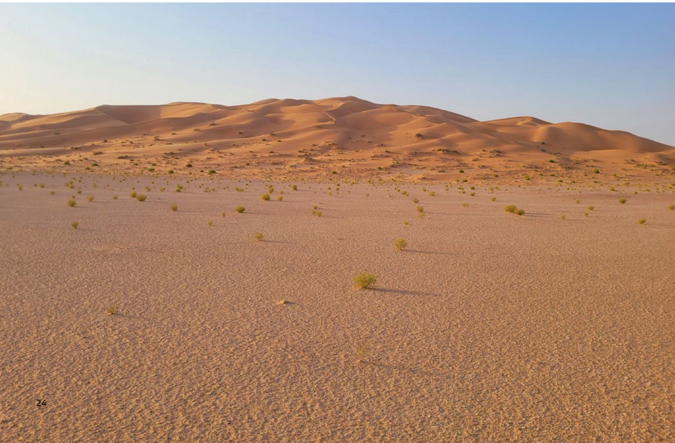
Die Wüste vom Oman in der schon so viele Meteoriten gefunden wurden. Ein faszinierender Ort.