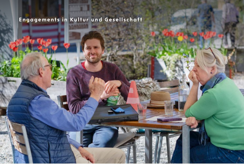
Gespräche im Grünen: Vor dem Begegnungszentrum im Höchhus treffen sich Menschen zum Austausch.