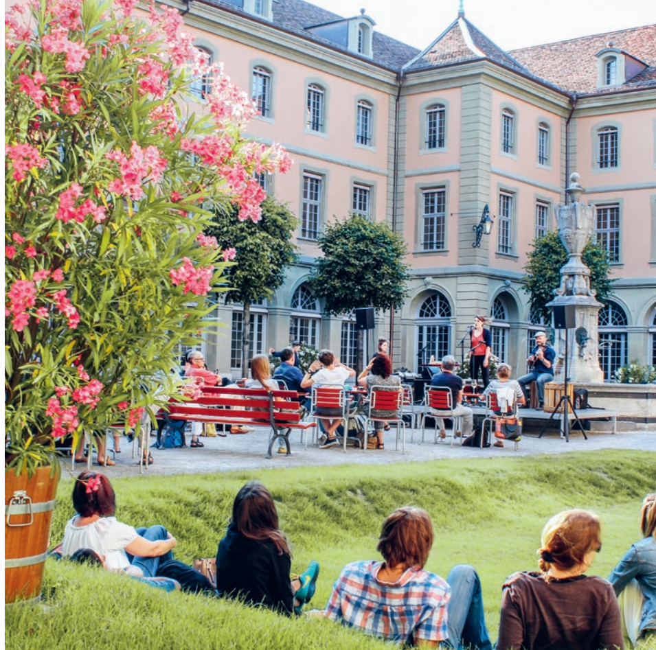
Der Burgerspittel am Bahnhofplatz → Informationen ab Seite 15

Der Burgerspittel im Viererfeld und am Bahnhofplatz zeichnet sich als einzigartige Institution für ein sicheres Wohnen im Alter mit hoher Lebensqualität aus – dank des Vollangebots und der überdurchschnittlichen Servicequalität. Engagierte, sozial- und fachkompetente Mitarbeitende stellen sicher, dass sich die Bewohnerinnen und Bewohner rundum wohl und umsorgt fühlen. Oberste Maxime sind die Autonomie und die Erhaltung grösstmöglicher Lebensqualität – bis zum Lebensende.