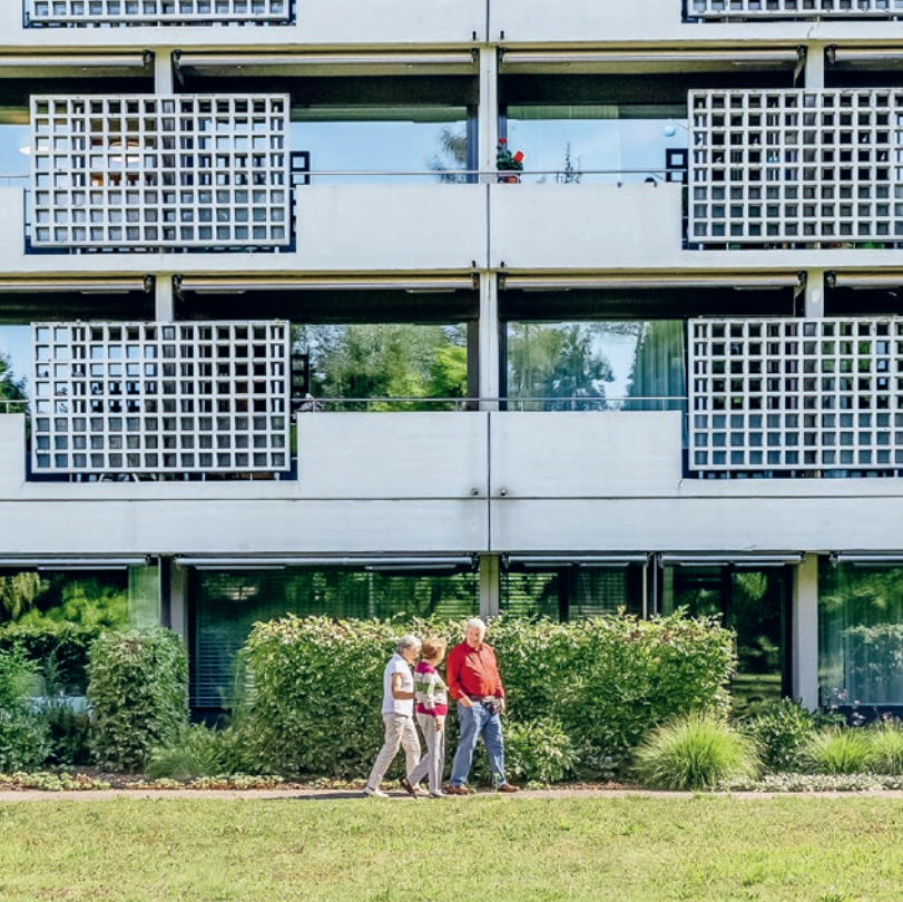
Der Burgerspittel im Viererfeld → Informationen ab Seite 4